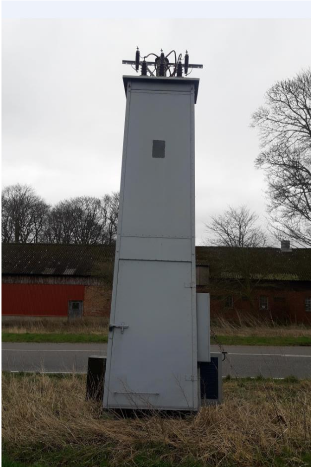
Figur 3. Foto fra ansøgningen, der viser et tårn tilsvarende den gamle transformestation.

Det gamle tårn målte ca. 2 m x 1,5 m x 7 m og den nye station: 2,3 m x 1,3 x 1,7 m. Se figur 3-4