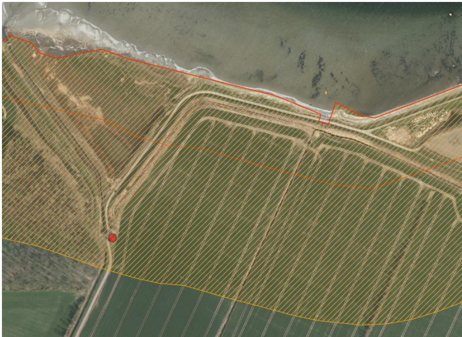
Figur 1. Luftfoto – forår 2019. Rød prik viser placering af transformerstationen. Orange skravering markerer strandbeskyttelseslinjen. Orange streg markerer gl. line. Rød streg markerer matrikelskel

Transformerstationen er beliggende i udvidet linje. Strandbeskyttelseslinjen blev udvidet for området den 2. september 2002 og transformerstationen er derfor lovligt opført. Se figur 1 – 2.