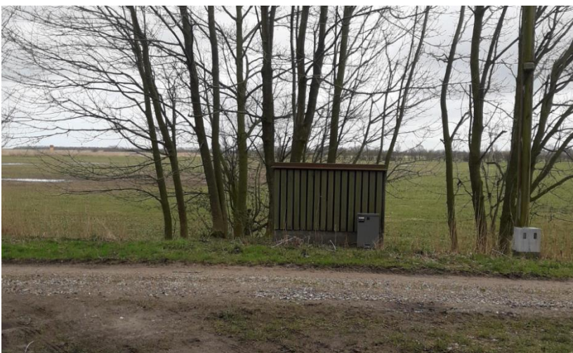
Figur 4. Foto fra ansøgningen, der viser den nye transformestation.