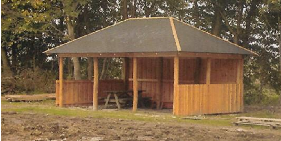
Figur 1 - Typen af madpakkehus som ønskes opført.

Madpakkehuset skal fungere som et multihus til ophold, leg og undervisning. Der er offentlig adgang til madpakkehuset. Huset bliver på 24 kvadratmeter. Det opføres i træ med tag af enten tagpap eller brædder af lærk.