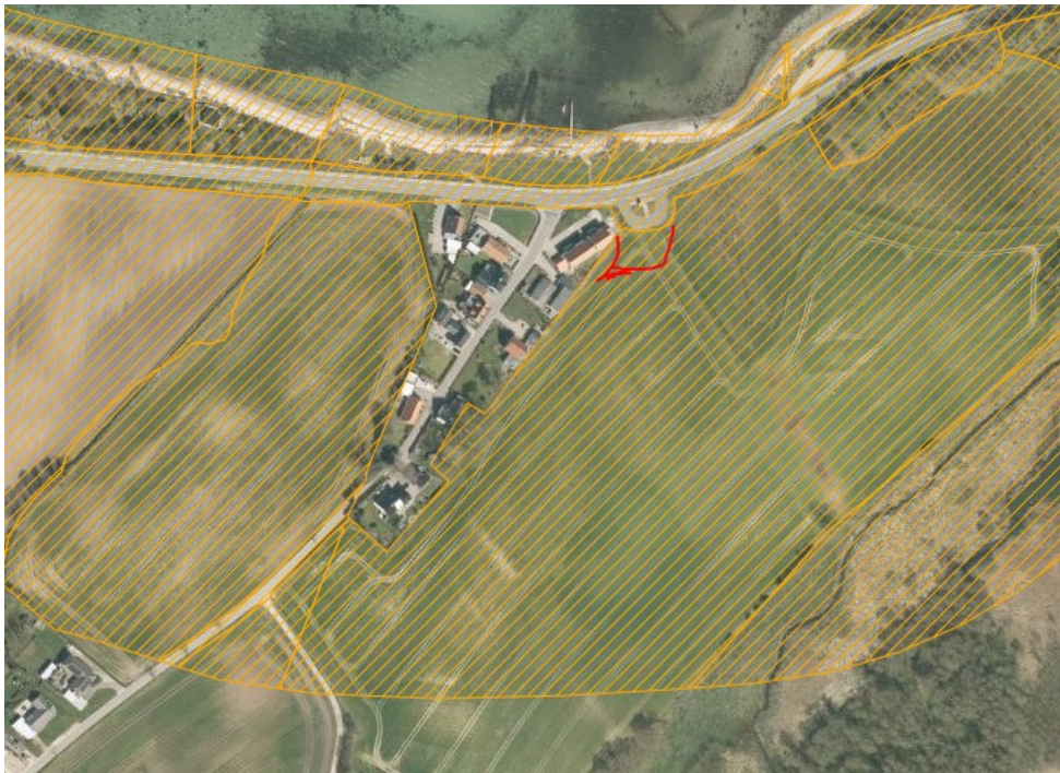
Strandbeskyttelseslinene i området – berørt område angivet med rød