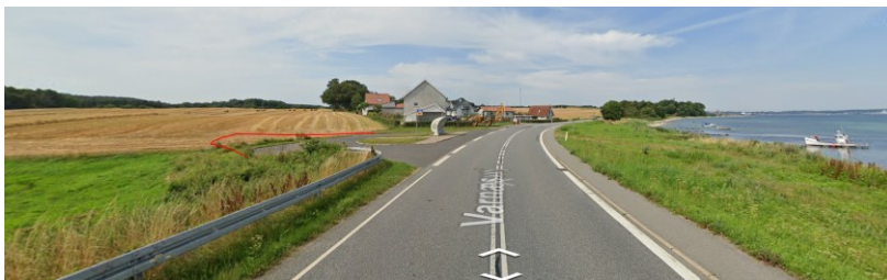
Området for pumpebrønd vist med rød; arbejdsareal placeres bag Under: Areal der udstykkes – arbejdsareal og placering af pumpebrønd

Arbejdsarealet er placerer umiddelbart op til arealet hvor pumpebrønden placeres. Arealet skal være i brug ca. 6 mdr. fra arbejdet påbegyndes og retableret efter brug.