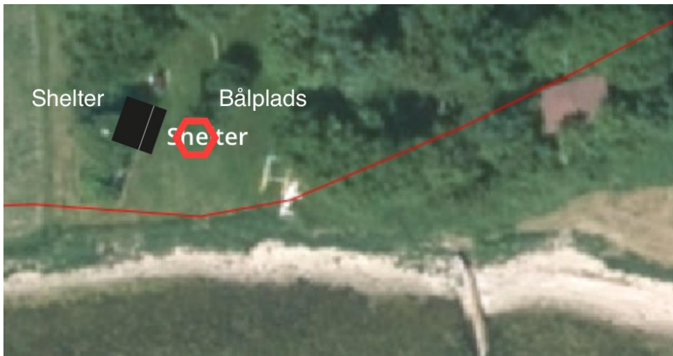
Fig. 2. Detailkort fra ansøgningen over placeringen af de ansøgte faciliteter.

Ifølge ansøgningen vil den ansøgte shelterplads være åben for offentligheden og målrettet mange forskellige typer af brugere såsom kajakroere, cykellister og vandrere.