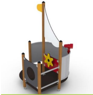
Legeskib placeres hvor baderumsbygningen står i dag

Vi mener, at denne ny placering vil højne helhedsindtrykket af bygningsmassen.