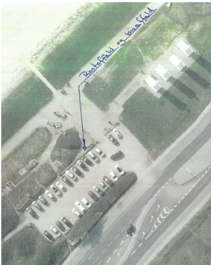
Fig. 1. Foreslået areal, hvor affaldsløsningen ønskes placeret.

Den ønskede affaldsløsning ses på fig. 2, hvor målene også er noteret. Den laves i en model i cortenstål.