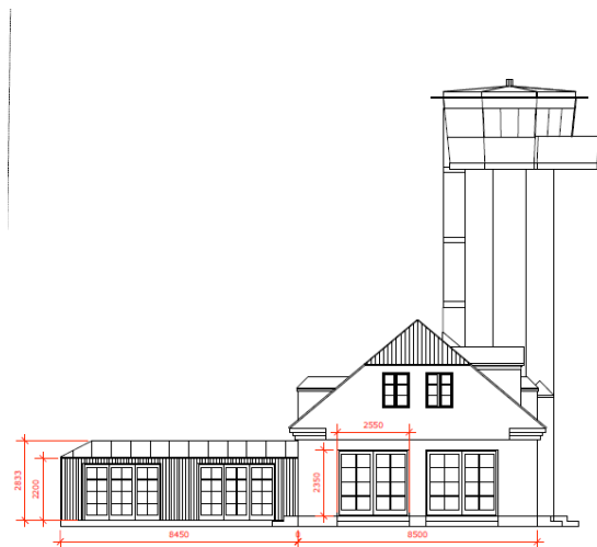
Tegning fra ansøgning