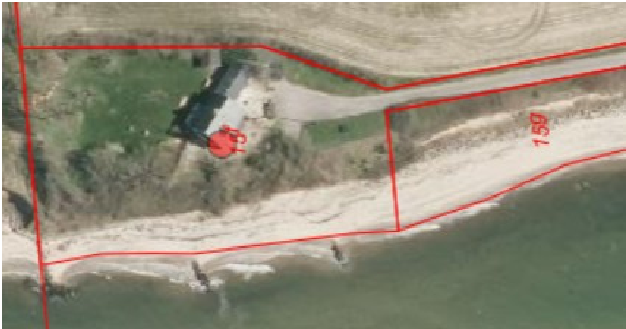
Parcelhusets placering på ejendommen. Hele ejendommen ligger indenfor 50 meter af kysten