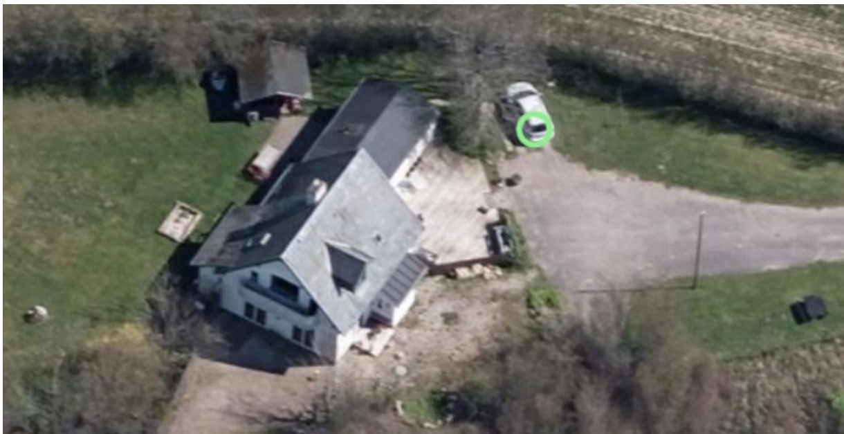
Skråfoto 2019, hvor den ønskede placering af garagen er markeret