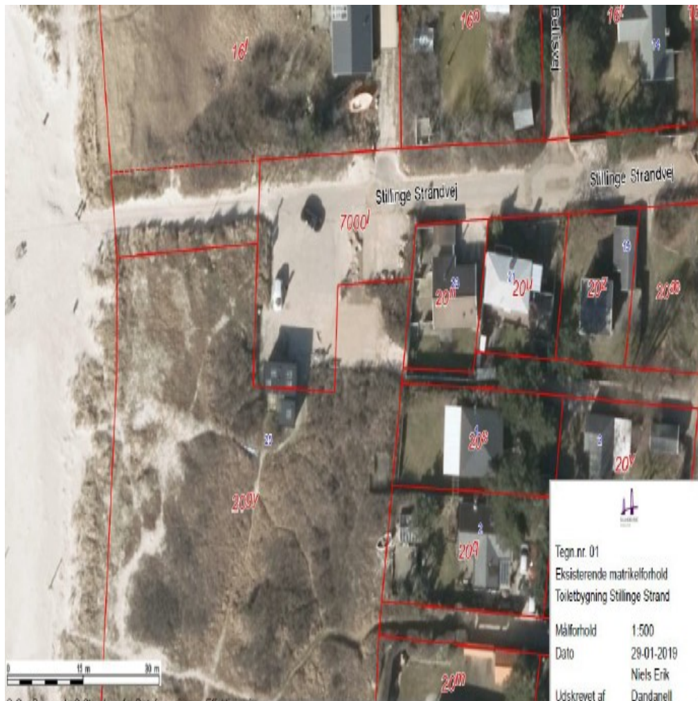
Figur 2. parkerings- og vendearealet hvor eksisterende toiletbygning ses liggende henover 2 matrikler, som rød linje markerer.

flisebelægning omfatter begge matrikler som det fremgår af figur 2 og figur 3.