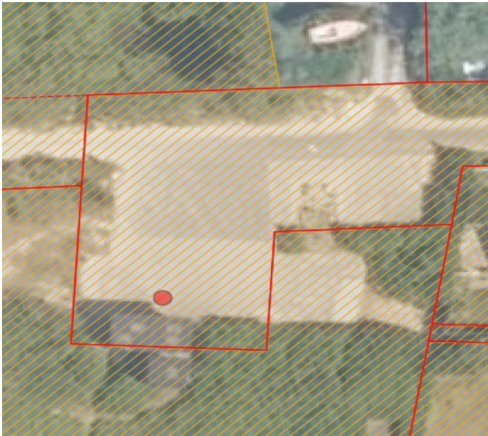
Figur 1. Strandbeskyttet areal markeret med gul skravering.

Slagelse Kommune oplyser at ”eksisterende toiletbygning er nedbrudt i konstruktioner og ikke opfylder krav ift. handicap og områdets generelle behov i sommerperioden, samt at der er et øget behov for vinterbadere etc.” Matrikel 70001 er udlagt til vejareal og er delvist beliggende i strandbeskyttelseslinjen. Matrikel 20gy er fuldt ud omfattet af beskyttelseslinjen. Se figur 1.