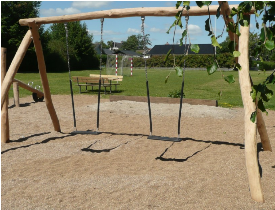
Illustration 3 – Gyngestativet som bliver placeret på et flis underlag på 8 m x 4,25 Der placeres endvidere et skilt ved gyngestativet – se illustration 4