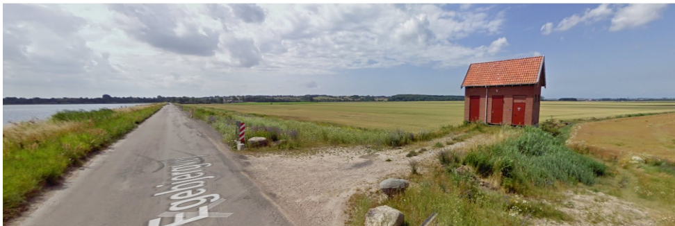
Figur 1. Sidingedæmningens pumpehus på Egebjergvej.

Skiltetypen fremgår af figur 3 og dimensionerne på skiltet, som oplyst i ansøgning er; pælemål (H x L x B): 12,5 x 12,5 x 280 cm. Skiltemål (H x L): Dvs. den plade vores grafiker skal lave: Synligt mål: Højde x bredde: 99 x 70 cm. Der opstilles 1 skilt svarende til det i ansøgningen fremsendte foto, dog uden rød maling. Figur 3.