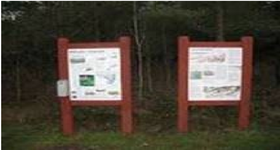
Figur 3. Eksempel på skiltetypen der opstilles ved Sidingedæmningens pumpehus.

Ejendommen er beliggende ca. 4,3 km fra nærmeste Natura 2000-område nr. 262 Annebjerg Skov og Ulkerup Skov (habitatområde nr. H271, (afstand 4,5 km) fuglebeskyttelsesområde nr. F94 (afstand ca. 10 km), jf. bekendtgørelse nr. 1595 af 6. december 2018 om udpegning og administration af internationale naturbeskyttelsesområder samt beskyttelse af visse arter.