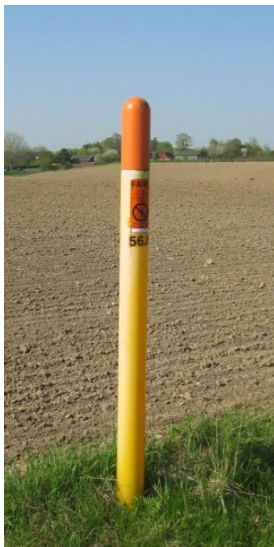
Fig. 2. Eksempel på markeringspæl.

Synligt vil der blive placeret en ca. 1,8 m høj gul markeringspæl (fig. 2). Pælen vil blive funderet 50-60 centimeter, og hullet graves typisk med en pælespade, så påvirkningen berører et areal på mindre end \frac{1}{4} kvadratmeter. Etablering af pælen sker i forbindelse med retablering af områderne, umiddelbart efter etablering af gasrørledningen.