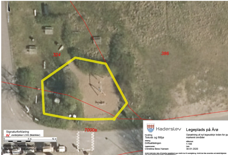
Figur 1. Nyt luftfoto fra ansøgning, der markerer legepladsens nye placering (gul streg)

Der er søgt om dispensation til udskiftning af legeudstyr samt udvidelse af legeplads på en matrikel, der ejes af Haderslev Kommune. Se figur 1.