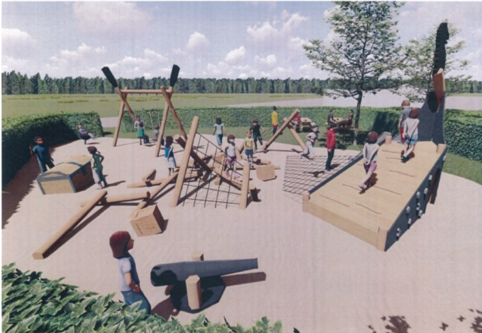
Figur 2. Billede fra ansøgningen, der visualiserer udvidelsen af legepladsen