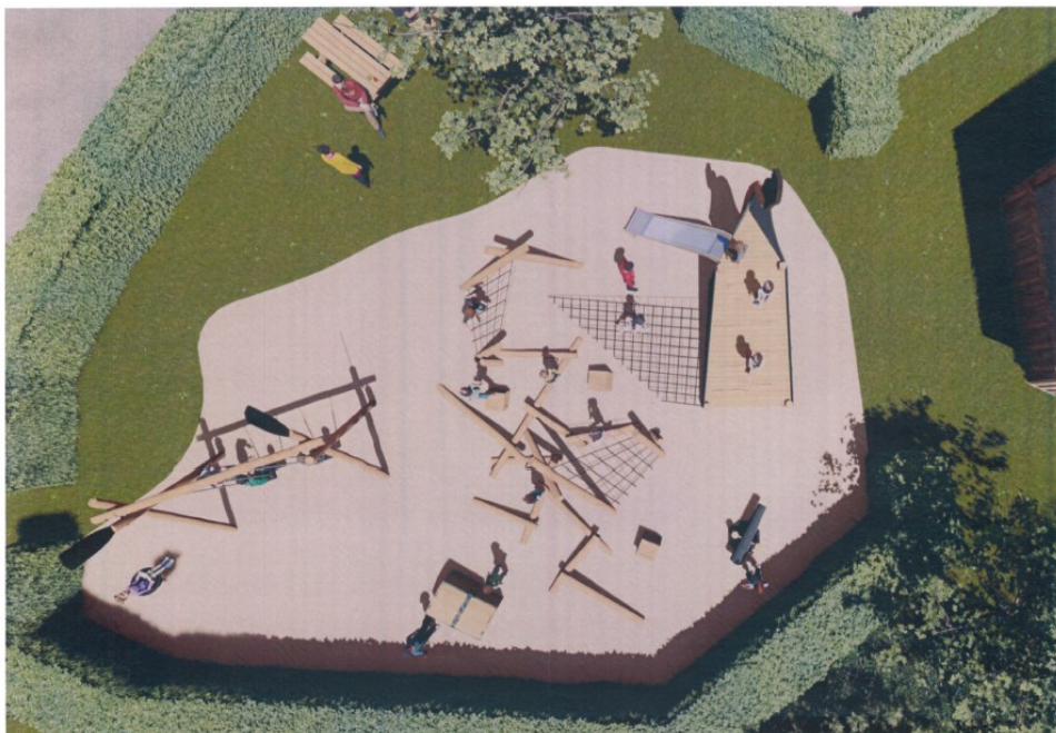
Figur 3. Billede fra ansøgningen, der visualiserer udvidelsen af legepladsen