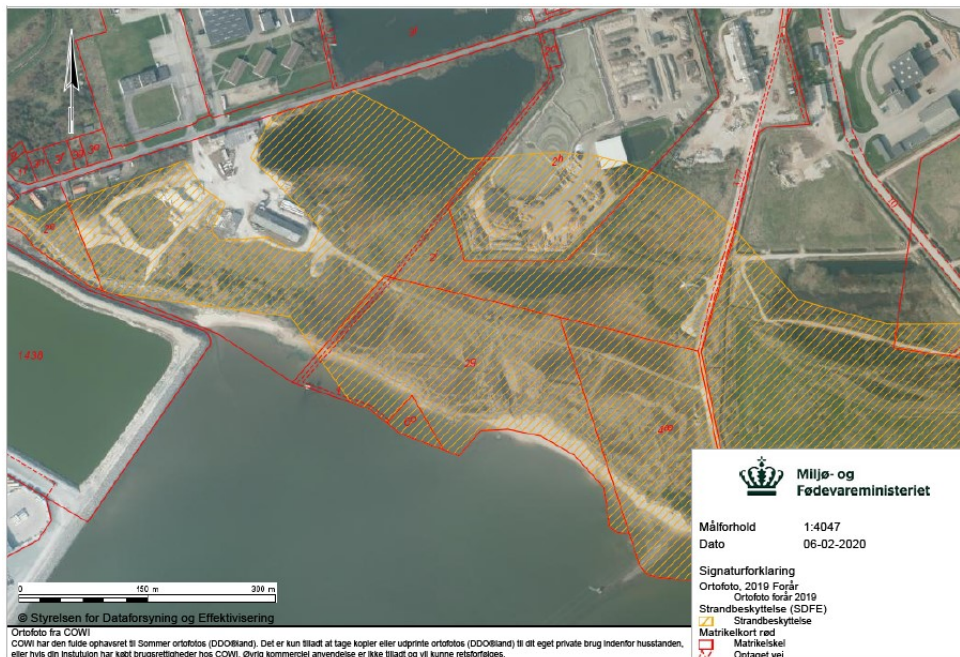
Fig. 1. Luftfoto af området ved Måde, strandbeskyttelseslinjen angives med orange skraver og matrikler med rød linje.

Måde WTG 1-2 K/S søger om dispensation fra strandbeskyttelseslinjen til opsætning af 2 forsøgsvindmøller, vejanlæg, kranpladser, transformator samt kabellægning langs vejanlægget på matr. nr. 2i, 2g og 4æ Måde, Esbjerg Jorder (fig. 1 og bilag 1).