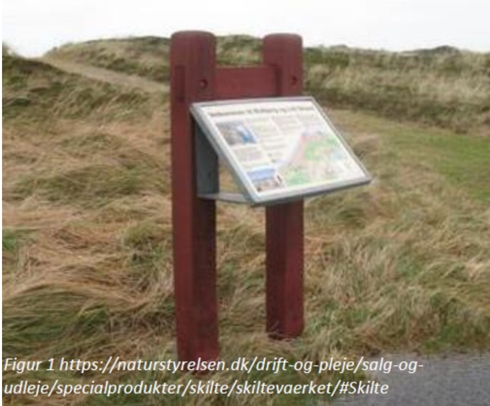
Figur 1. Informationsskilt jf. ansøgning i svenskrød

”Tavlerne skal begge være i A2 størrelse skrånende på dobbeltpæle. På Marienlyst Strand skal pælene være sorte og på Skotterup Strand skal pælene være svenskrøde.” Figur 1.