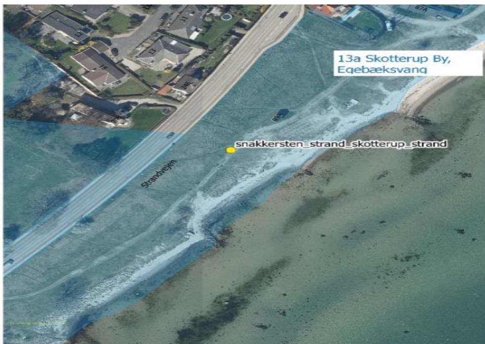
Figur 3. Punktet for opstilling af skilt på Skotterup Strand er markeret med gul prik.

På Skotterup Strand opsættes tavlen mellem to trampestier. Figur 3.