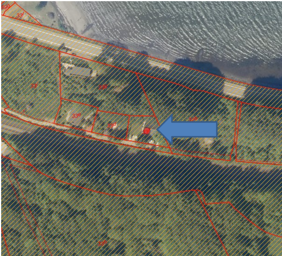
Figur 1. Strandbeskyttelseslinjen er markeret med gul skravering

Ejendommen er i sit hele omfattet af strandbeskyttelseslinjen og er beliggende på en stribe mellem en større vej og en togbane. Figur 1.