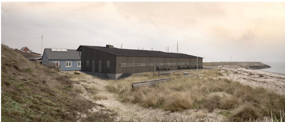
Perspektiv fra kystsiden, projekteret. Figur fra ansøgningen.