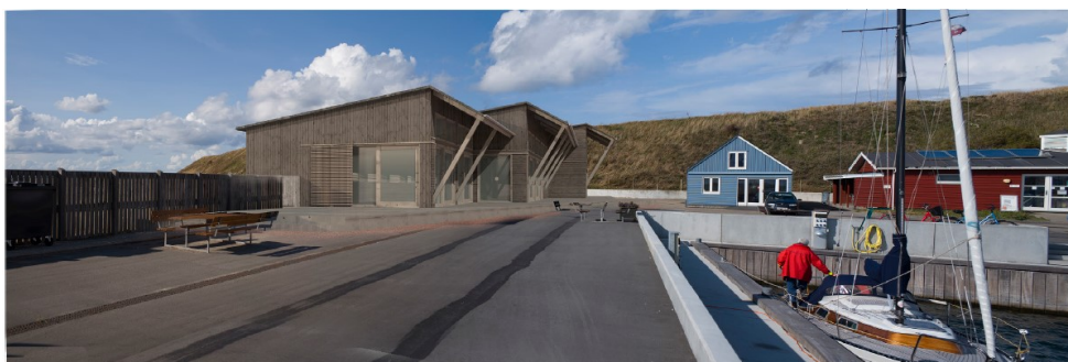
Perspektiv fra kystsiden, projekteret. Figur fra ansøgningen.