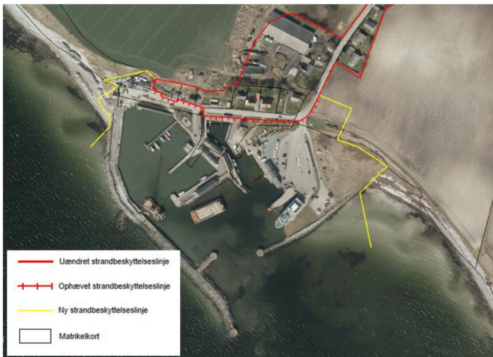
Ophævet og ny strandbeskyttelseslinjes forløb

Kystdirektoratet har, på baggrund af en ansøgning fra Kalundborg Kommune, i medfør af naturbeskyttelseslovens §69 stk. 3, ophævet strandbeskyttelseslinjen på størstedelen af Sejerø havn. Det projekterede Øhus overskrider den nugældende strandbeskyttelseslinje med ca. 10 m 2 . Der søges derfor dispensation til den del af byggeriet samt den del af terrassen, der ligger inde for strandbeskyttelseslinjen.