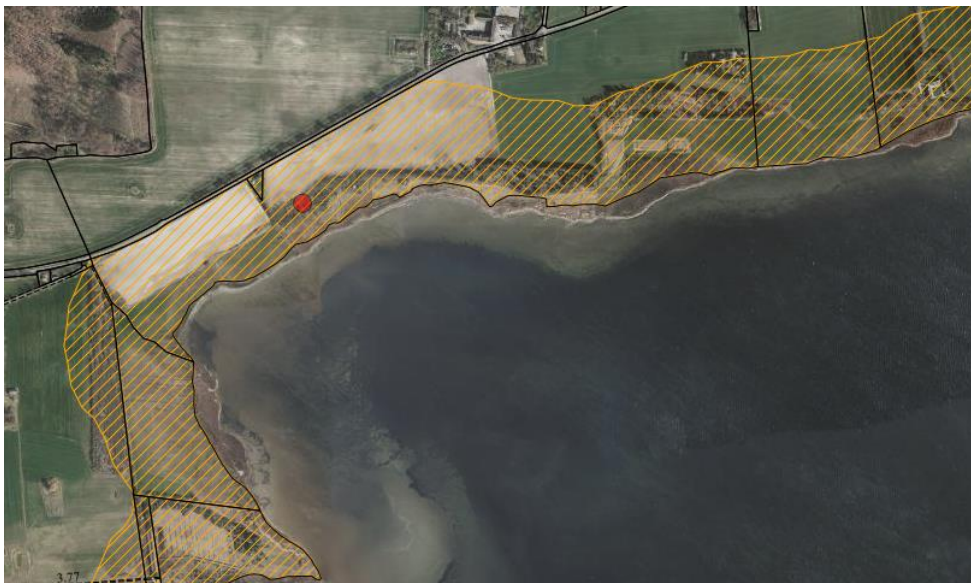
Fig. 1. Ortofoto 2019. Den røde prik markerer placeringen af minivådområdet. Det orange skraverede område markerer det strandbeskyttede areal. De umatrikulerede arealer ud til kysten samt stranden er dog også omfattet af bestemmelserne om strandbeskyttelse.

Minivådområdet ønskes konstrueret med lavvandede områder vekslende med bassiner med større dybde samt et sedimentationsbassin (se fig. 1-3).