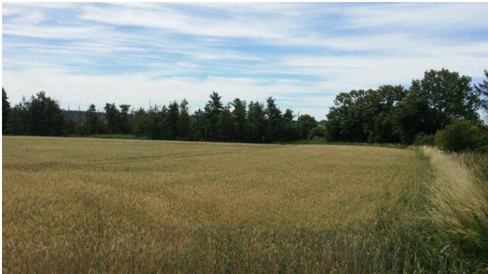
Fig. 3. Billede fra ansøgningsmaterialet, der viser placeringen af minivådområdet. I dag er der et delvis udgået ellekrat. Etableres minivådområdet bliver der frit udsyn ud over fjorden.

I ansøgningen fremgår følgende begrundelse for etablering af minivådområdet: