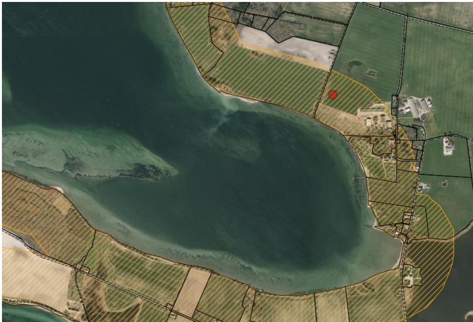
Fig. 1. Ortofoto 2019. Den røde prik markerer placeringen af minivådområdet. Det orange skraverede område markerer det strandbeskyttede areal. De umatrikulerede arealer ud til kysten samt stranden er dog også omfattet af bestemmelserne om strandbeskyttelse. De sorte streger markerer matrikelskel.

På den ovennævnte matrikel ønskes der etableret et 0,3 ha stort minivådområde beliggende ud til Gamborg Fjord. Minivådområdet ønskes konstrueret med lavvandede områder vekslende med bassiner med større dybde samt et sedimentationsbassin (se fig. 1-2).