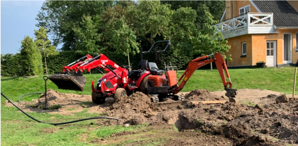
Figur 2. Billede fra ansøgningen, der viser maskinerne.

Ansøger oplyser desuden, at etableringen af jordvarmeanlægget allerede er i gang og forventer at projektet har en slutdato den 31. marts 2020.