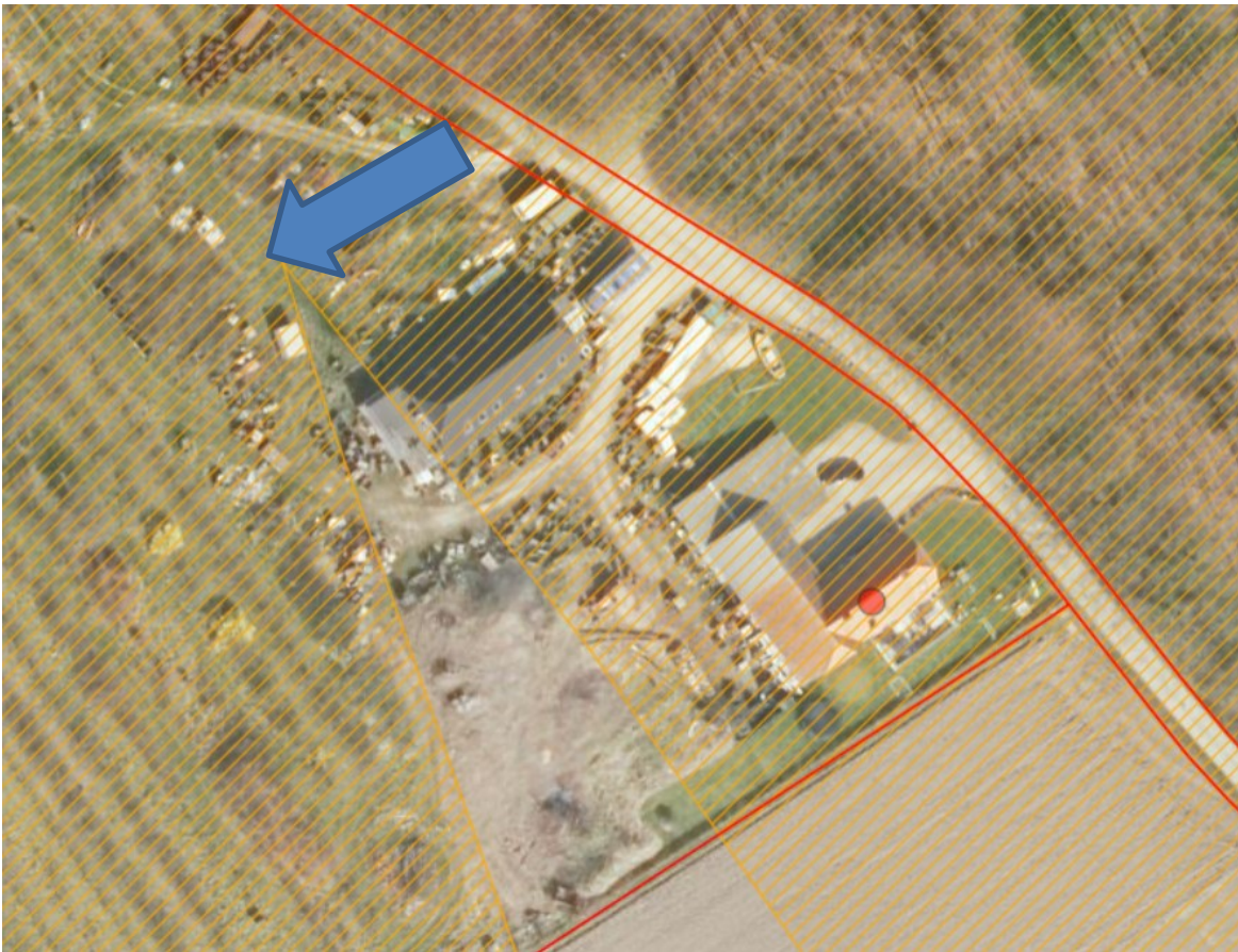
2019, ortofoto, frugthallen ønskes placeret ved markeringen på kortet

Den ønskede placering af frugthallen er i forbindelse med de nuværende driftsbygninger på ejendommen.