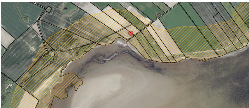
Fig. 1. Ortofoto 2018. Den røde prik markerer placeringen af minivådområdet. Det orange skraverede område markerer det strandbeskyttede areal. De umatrikulerede arealer ud til kysten samt stranden er dog også omfattet af bestemmelserne om strandbeskyttelse. De sorte streger markerer matrikelskel.

På de ovennævnte matrikler ønskes der etableret et minivådområde beliggende ud til Limfjorden. Minivådområdet ønskes konstrueret med lavvandede områder vekslende med bassiner med større dybde samt et sedimentationsbassin (se fig. 1-2).