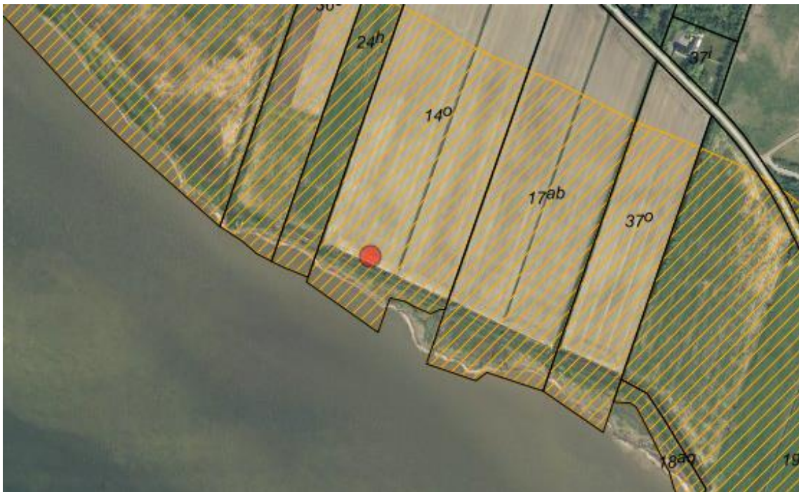
Fig. 1. Ortofoto 2018. Den røde prik markerer placeringen af minivådområdet. Det orange skraverede område markerer det strandbeskyttede areal. De umatrikulerede arealer ud til kysten samt stranden er dog også omfattet af bestemmelserne om strandbeskyttelse.