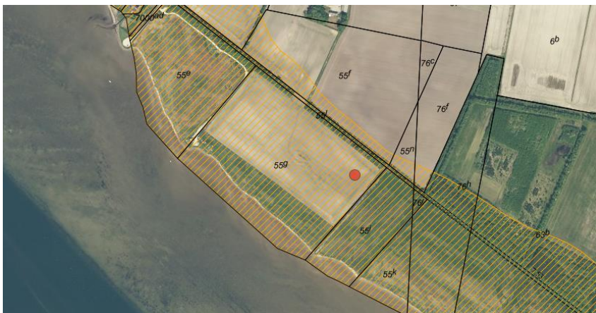
Fig. 1. Ortofoto 2018. Den røde prik markerer placeringen af minivådområdet. Det orange skraverede område markerer det strandbeskyttede areal. De umatrikulerede arealer ud til kysten samt stranden er dog også omfattet af bestemmelserne om strandbeskyttelse.

På den ovennævnte matrikel ønskes der etableret et minivådområde på et omdriftsareal beliggende ud til Limfjorden. Minivådområdet ønskes konstrueret med lavvandede områder vekslede med bassiner med større dybde samt et sedimentationsbassin (se fig. 1-2).