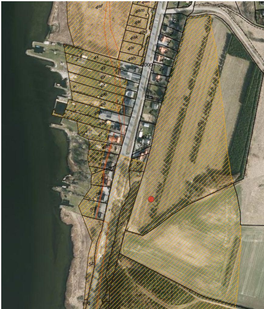
Figur 1. Kort over den omtalte ejendom. Den røde prik markerer ejendommen. De sorte streger markerer matrikelskel. Den gule skravering markerer den udvidet strandbeskyttelseslinje, og den røde strek markerer den oprindelige strandbeskyttelseslinje.

Det fremgår af ansøgningen, at ejerne ønsker at udstykke en ny byggegrund fra matrikel 6i Haderup By, Vindblæst.