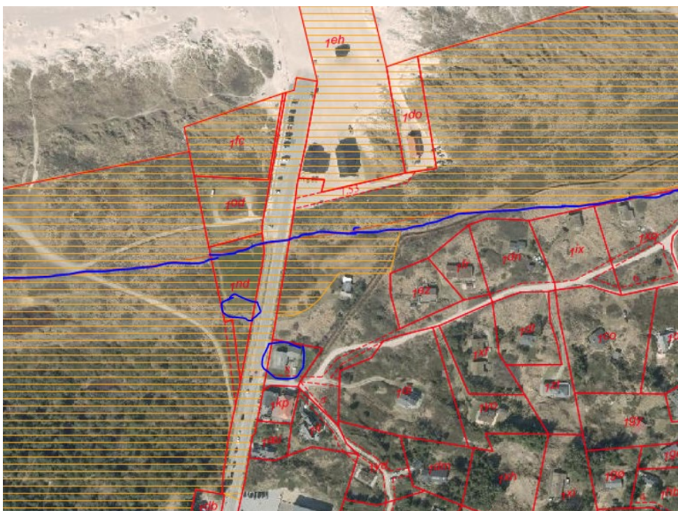
Blå linje – oprindelig klitfredningslinje / skraueret gældende klitfredning Blå cirkler – parkeringsareal og restaurantens placering

Ejendommen er beliggende i Natura 2000-område nr. 13 Svinkløv Plantage og Grønne Strand, habitatområde nr. 13, jf. bekendtgørelse nr. 926 af 27. juni 2016 om udpegning og administration af internationale naturbeskyttelsesområde samt beskyttelse af visse arter.