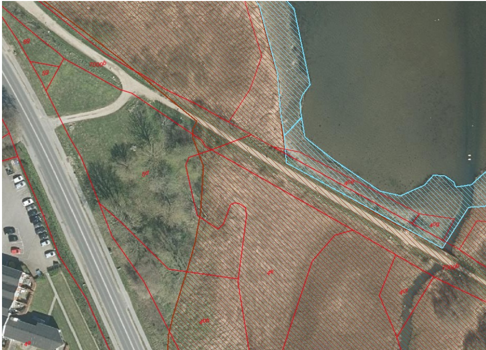
§3- områder skrueret

Projektet skal ses i sammenhæng med de tilsvarende mål om at separatkloakere Rebæk, der er bydelen øst for Tved. Separatkloakering af ejendommene i Tved er dels begrundet i det aldrende ledningssystem, som er hydraulisk overbelastet, og dels begrundet i at der sker overløb af fællesvand til Kolding Fjord.