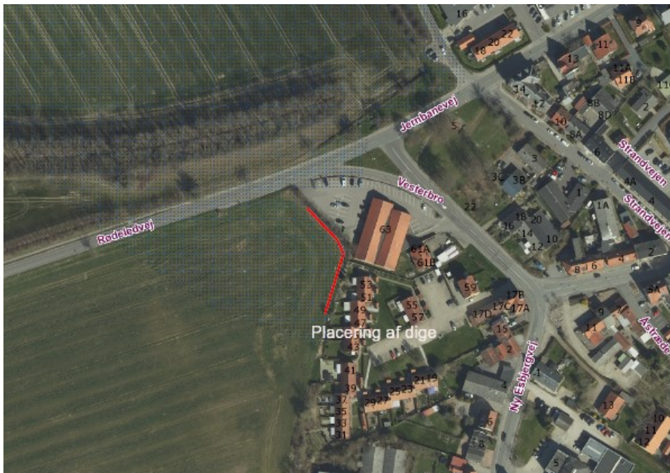
Placering af diget markeret med rødt. Opsamling af overfladevand fra bakken mod sydvest. Figur indsat fra ansøgningen.