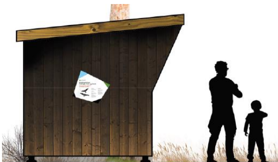
Fig. 3. Skitsetegning af madpakkehuset fra ansøgningsmaterialet.

Skitsetegning og referencebillede af det ansøgte madpakkehus kan på fig. 3-4.