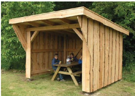
Fig. 4. Referencebillede fra ansøgningsmaterialet. Madpakkehuset vil fremstå i en mørkere farve, da det behandles med trætjære.