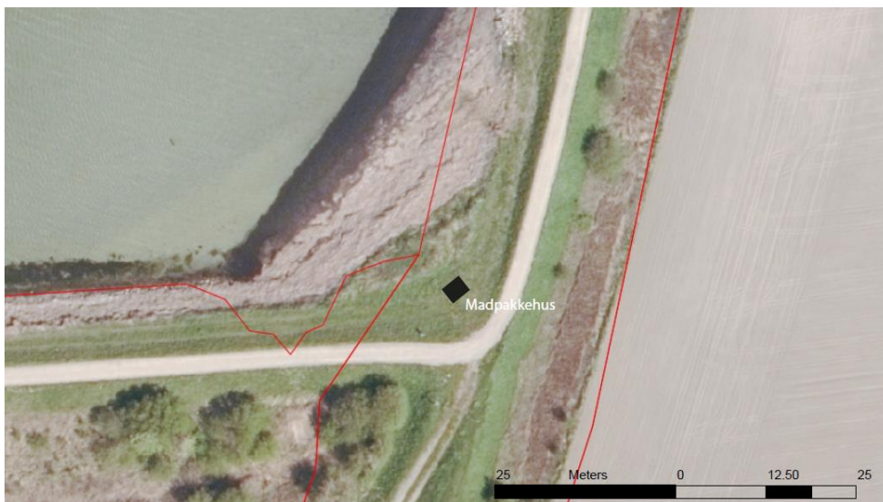
Fig. 2. Billede fra ansøgningsmaterialet, der viser placeringen af madpakkehuset.

Ifølge ansøgningen vil det ansøgte madpakkehus/rasteplads være åben for offentligheden og målrettet mange forskellige typer af brugere såsom kajakroere, cykellister og vandrere.