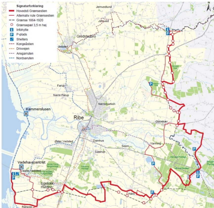
Fig. 2. Kort over den 30 km lange Grænsesti, hvor informationsbygningerne er indtegnet (blåfirkant med I), samt de andre seværdigheder og stier i området.