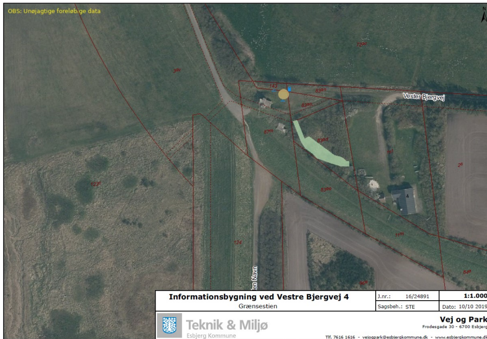
Fig. 1. Luftfoto af området ved Christian X Diget, hvor informationsbygning ønskes placeret (gul prik).