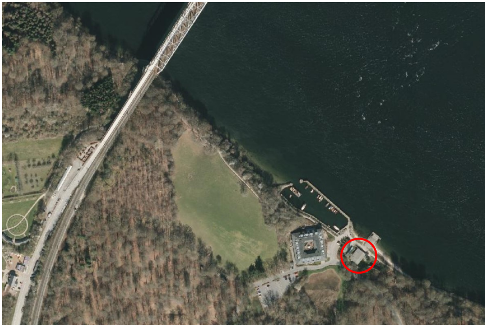
Luftfoto af området. Klubhuset er markeret med rød cirkel.

Middelfart Roklub søger om at udvide klubhuset med et ergometerrum på 42 kvm, en forbindelsesgang på 9 kvm og en terrasse på 56 kvm. Ergometerrummet og forbindelsesgangen etableres langs bygningens nordvestlige facade. Terrassen etableres ved bygningens nordlige hjørne, dvs. mod vandet og havnen. Terrassen udføres med terrassebrædder i niveau med bygningens eksisterende gulv.