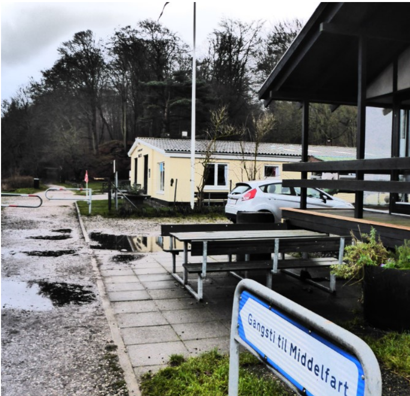
Foto af Klubhuset (den gule bygning). Tilbygningen sker langs den facade, der ses på billedet. Terrassen etableres ved det hjørne, der er nærmest fotografen. Vandet ligger til venstre.

Matriklen er ejet af Middelfart kommune, der har givet deres accept til projektet.