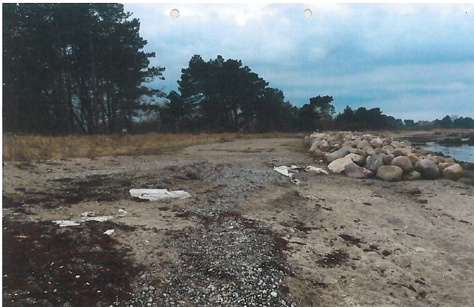
Foto fra ansøgningen, der viser området. Terrænændringen sker mellem bevoksningen til venstre og de udlagte sten til højre.

Skitse fra ansøgningen, der viser arealet der påfyldes sand. Bemærk at skitsen ikke er retvendt.