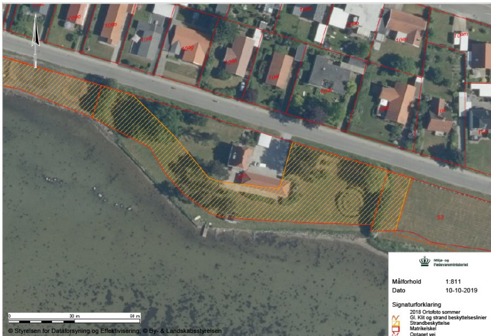
Fig. 1. Luftfoto af ejendommen, hvor orange skravering angiver strandbeskyttelseslinjen. Den gamle strandbeskyttelseslinje (orange linje) følger på matr. 17b Over Kærby, Kerteminde Jorder den nuværende strandbeskyttelseslinje.