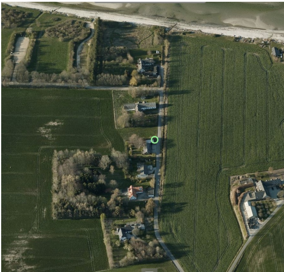
Bebyggelsen i området – ejendommen markeret med grøn cirkel

I nærværende ansøgning ansøges om etablering af altan under tagudhænget mod tilbygningen i stedet for terrassen over tilbygningen. Altanen holdes inden for tagets afgrænsning og værelsets areal reduceres. Taget hældning øges til 45 grader frem for 42 grader som i ansøgningen. Det bemærkes at huset herved vil have samme taghældning som bebyggelserne i området i øvrigt, hvorfor ansøger ikke finder at den øgede kiphøjde fra 5 m til ca. 6,9 m vil udgøre noget problem.