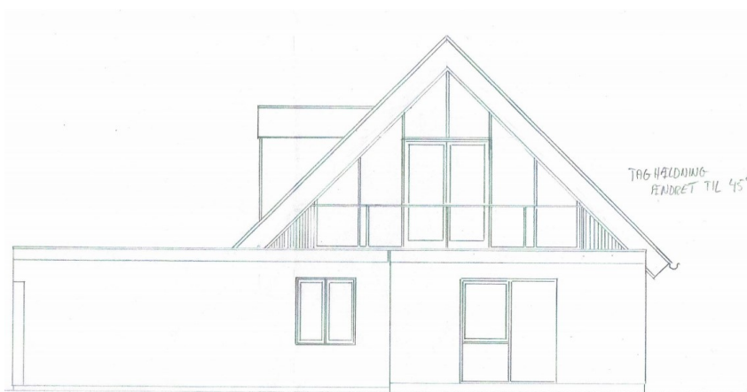
Facade mod nord (vandet)