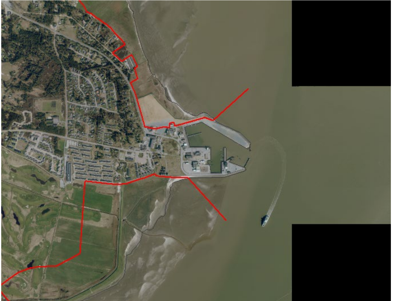
Figur 2. Luftfoto 2017 viser Rømø Havn. Strandbeskyttelseslinjen er markeret med rød.

Rømø Havn er ikke omfattet af strandbeskyttelseslinjen (se figur 2). Det ansøgte areal ligger lige nord for havnen.