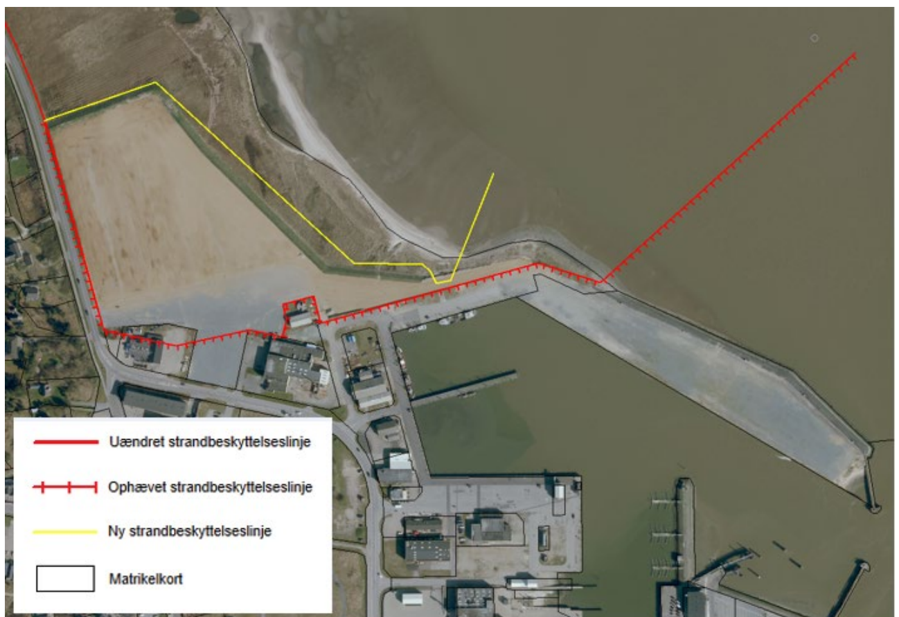
Figur 3. Kortudsnittet viser det nye forløb af strandbeskyttelseslinjen ved Rømø Havn som fastlagt af Kystdirektoratet.

På baggrund af afgørelsen vil Kystdirektoratet ændre strandbeskyttelseslinjens forløb som det fremgår af kortet i figur 3.