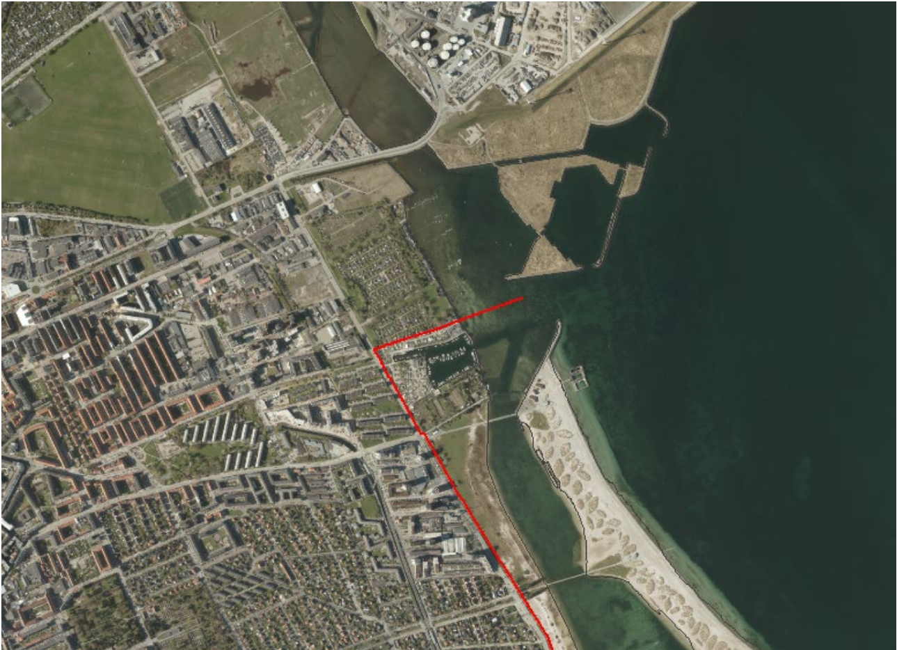
Figur 2. Luffoto 2017 viser Sundby Havn midt i billedet. Strandbeskyttelseslinjen er markeret med rød.

De ansøgte arealer er ikke omfattet af naturfredning efter naturbeskyttelseslovens kapitel 6.