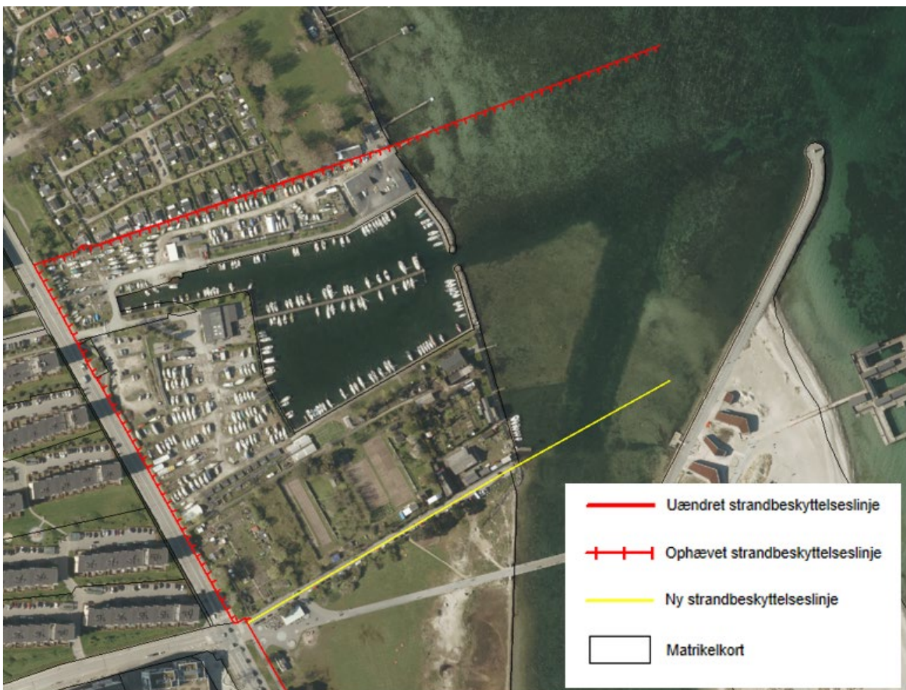
Figur 3. Kortudsnittet viser det nye forløb af strandbeskyttelseslinjen ved Sundby Havn som fastlagt af Kystdirektoratet.

På baggrund af afgørelsen vil Kystdirektoratet ændre strandbeskyttelseslinjens forløb, som det fremgår af kortet i figur 3.