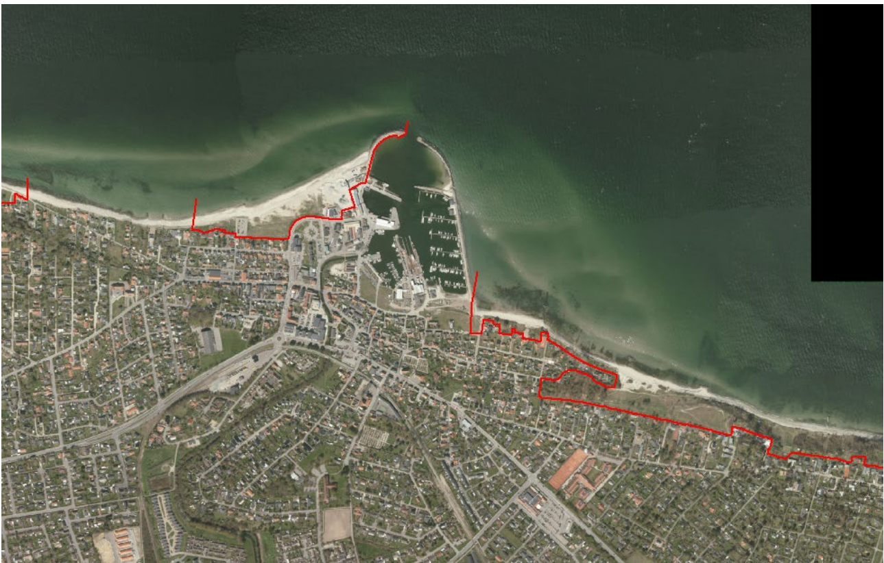
Figur 2. Luffoto 2017 viser Gilleleje Havn. Strandbeskyttelseslinjen er markeret med rød.

De ansøgte arealer består af den vestlige mole samt et areal vest for havnebassinerne, der anvendes af havnen.