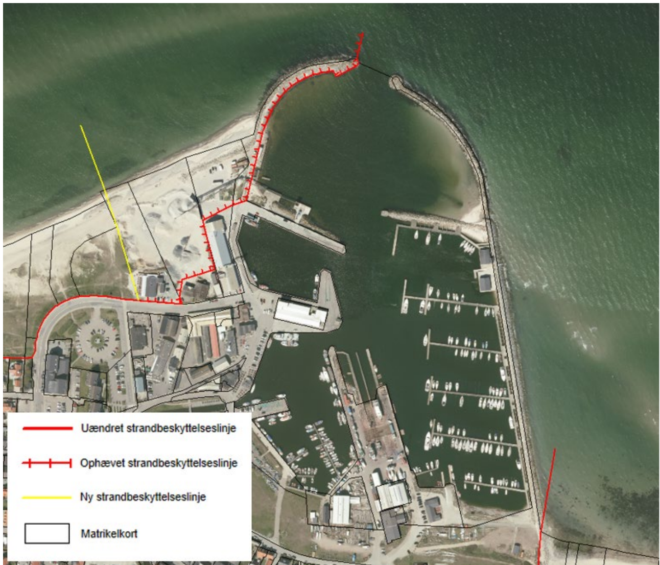
Figur 3. Kortudsnittet viser det nye forløb af strandbeskyttelseslinjen ved Gilleleje Havn som fastlagt af Kystdirektoratet.