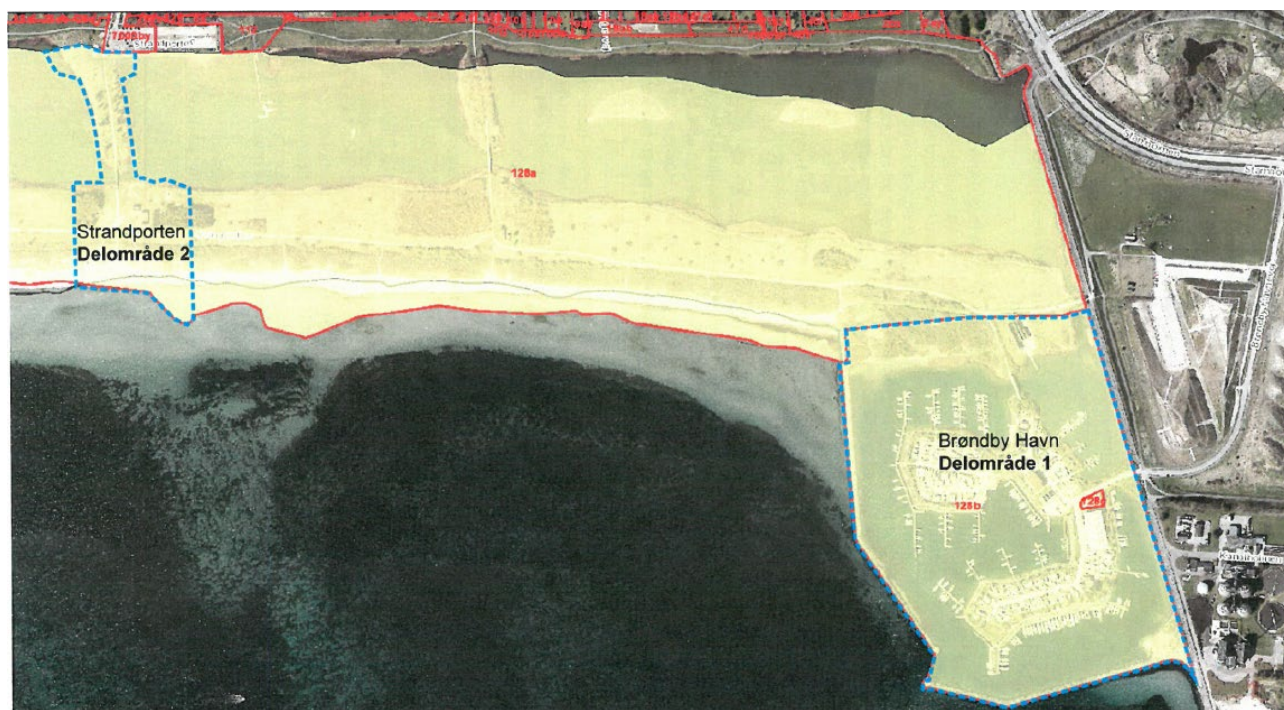
Figur 1. Kortudsnittet viser Brøndby Kommunes forslag til ændring/ophævelse af strandbeskyttelseslinjen på og ved Brøndby Havn (delområde 1) og ved Strandporten (delområde 2). Den stiplede blå linje afgrænser de to ansøgte delområder. Den gule farve viser strandbeskyttede arealer i Brøndby Kommune (arealet øst for den gule markering er en del af Hvidovre Kommune). Strandbeskyttelseslinjens forløb i hele området fremgår af figur 2.

Brøndby Kommune har ansøgt om ophævelse af strandbeskyttelseslinjen på to delområder henholdsvis på og ved Brøndby Havn (delområde 1) og ved Strandporten (delområde 2), se figur 1.