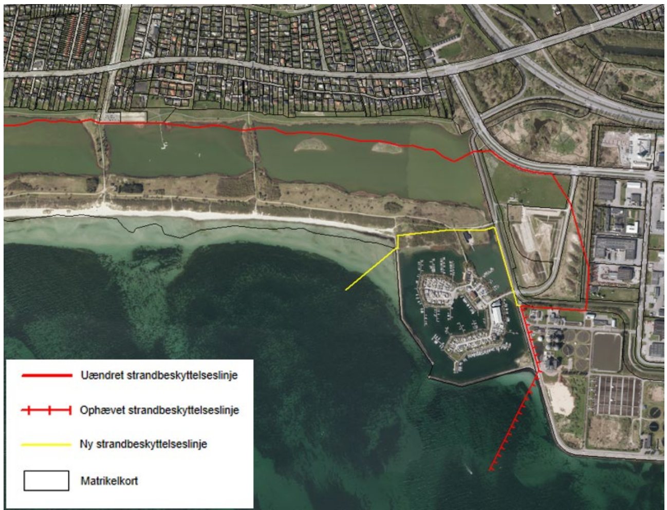
Figur 3. Kortudsnittet viser det nye forløb af strandbeskyttelseslinjen ved Brøndby Havn som fastlagt af Kystdirektoratet.