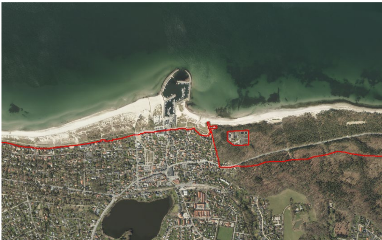
Figur 2. Luftfoto 2017 viser Hornbæk Havn midt i billedet. Strandbeskyttelseslinjen er markeret med rød.

De ansøgte arealer er ikke omfattet af naturfredning efter naturbeskyttelseslovens kapitel 6.