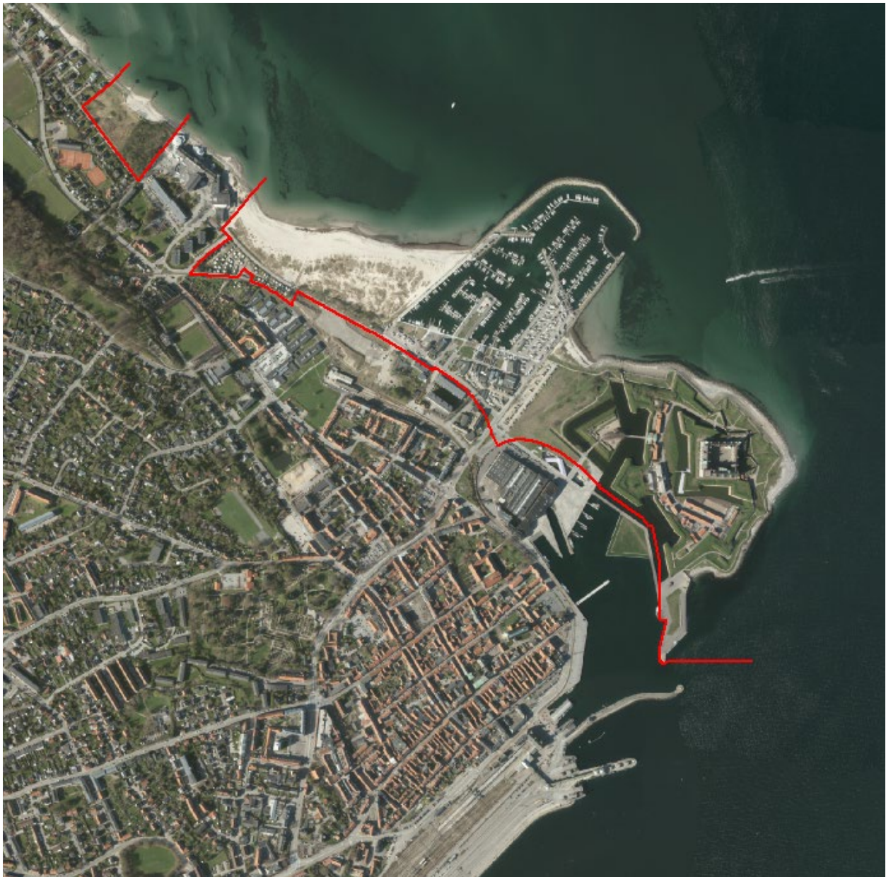
Figur 2. Luftfoto 2017 viser Helsingør Nordhavn midt i billedet. Strandbeskyttelseslinjen er markeret med rød.

De ansøgte arealer er ikke omfattet af naturfredning efter naturbeskyttelseslovens kapitel 6.