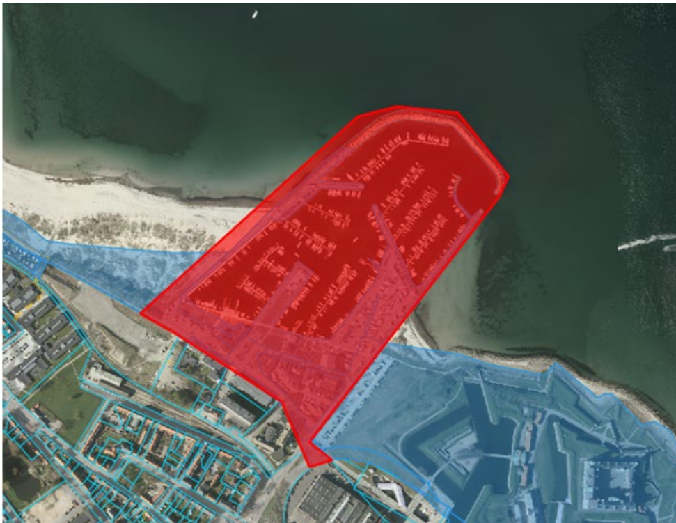
Figur 1. Kortudsnittet viser Helsingør Kommunes forslag til ændring/ophævelse af strandbeskyttelseslinjen på og ved Helsingør Nordhavn. De ansøgte arealer er vist med rød markering.

Helsingør Kommune har ansøgt om ophævelse af strandbeskyttelseslinjen på arealer på og ved Helsingør Nordhavn, se figur 1.