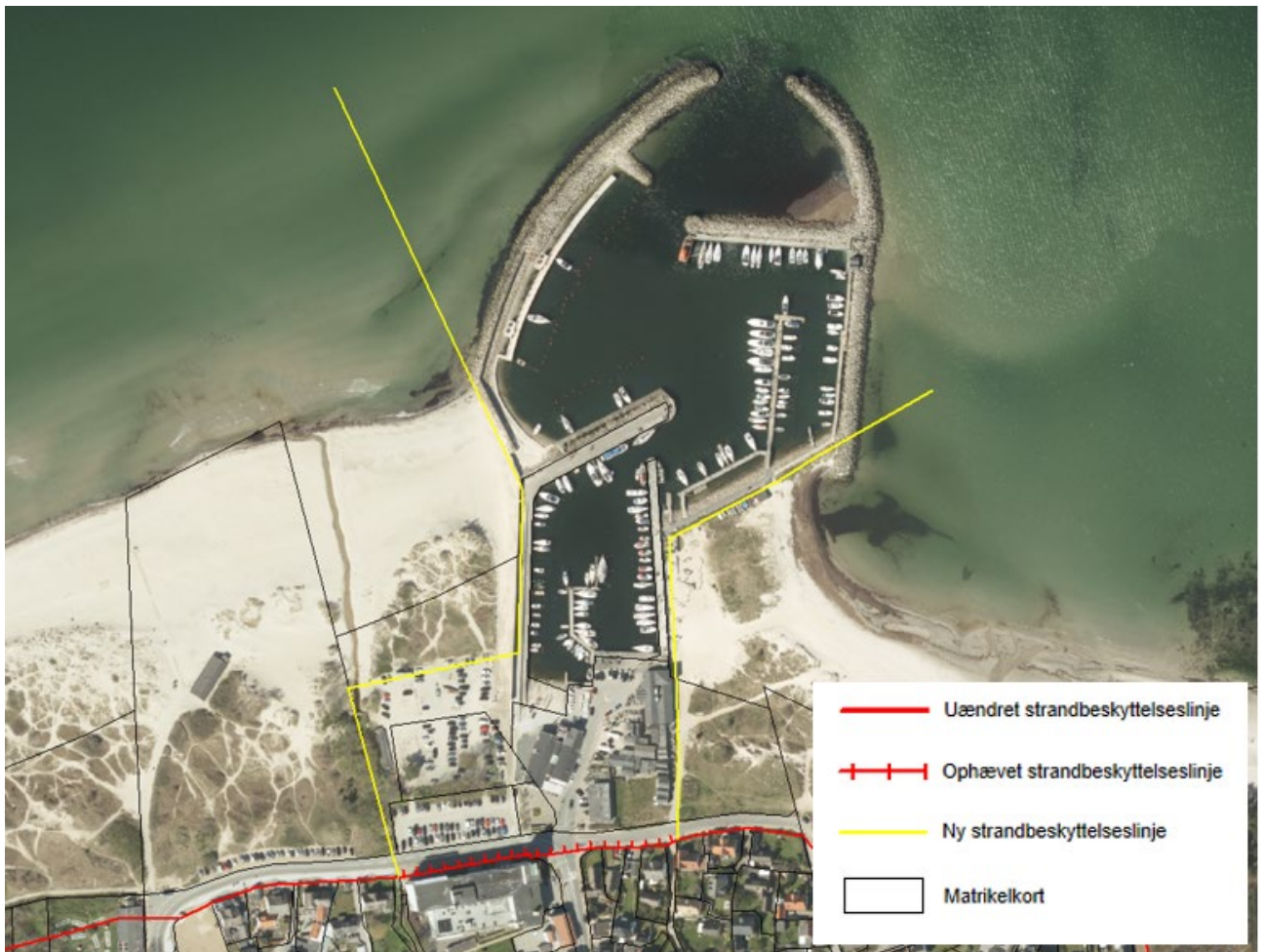
Figur 3. Kortudsnittet viser det nye forløb af strandbeskyttelseslinjen ved Hornbæk Havn som fastlagt af Kystdirektoratet.