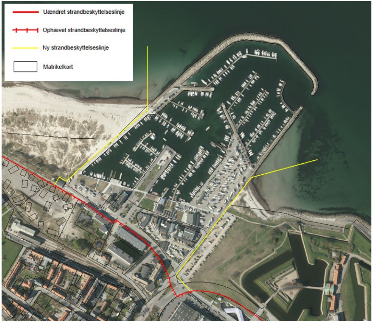
Figur 3. Kortudsnittet viser det nye forløb af strandbeskyttelseslinjen ved Helsingør Nordhavn, som fastlagt af Kystdirektoratet.

På baggrund af afgørelsen vil Kystdirektoratet ændre strandbeskyttelseslinjens forløb, som det fremgår af kortet i figur 3.