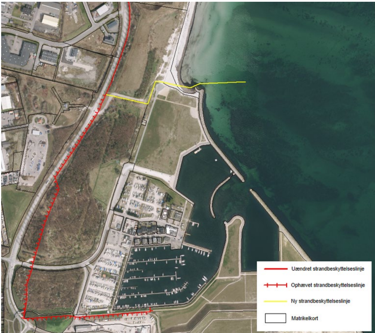
Figur 3. Kortudsnittet viser det nye forløb af strandbeskyttelseslinjen ved Køge Marina som fastlagt af Kystdirektoratet.