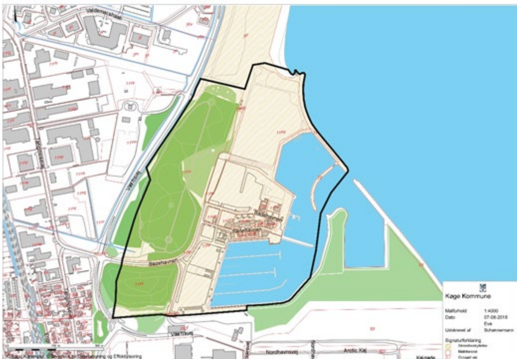
Figur 1. Kortudsnittet viser Køge Kommunes forslag til ændring/ophævelse af strandbeskyttelseslinjen på og ved Køge Marina. De ansøgte arealer er markeret med sort omrids.

Køge Kommune har ansøgt om ophævelse af strandbeskyttelseslinjen på arealer på og ved Køge Marina, se figur 1.