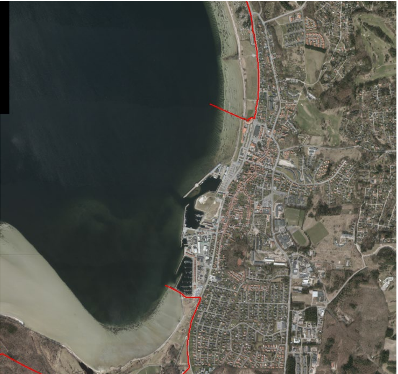
Figur 2. Luffoto 2017 viser Ebeltoft Skudehavn. Strandbeskyttelseslinjen er markeret med rød.

Det ansøgte areal er ikke omfattet af naturfredning efter naturbeskyttelseslovens kapitel 6.