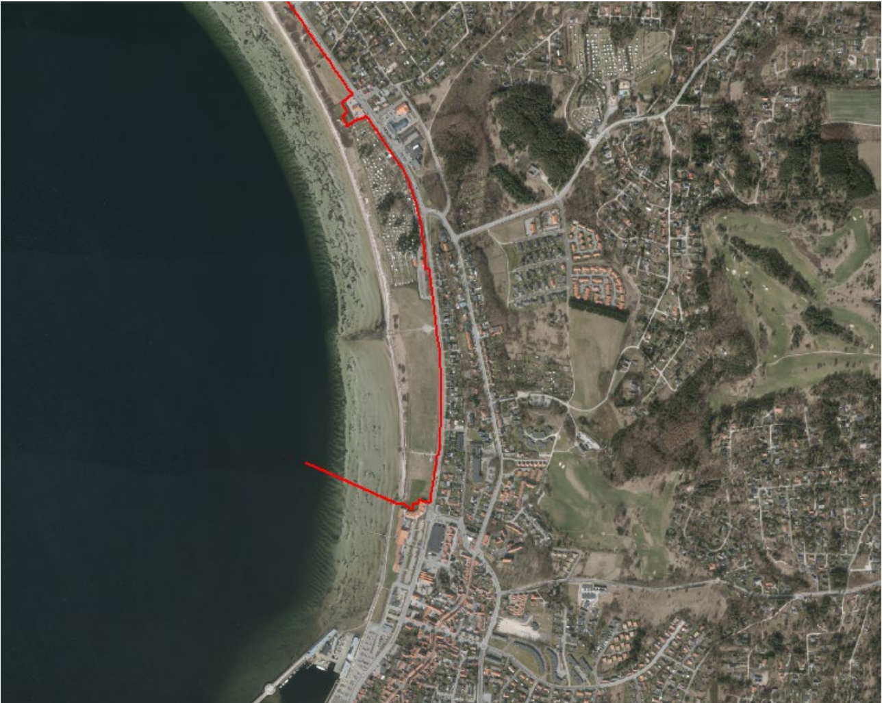
Figur 2. Luffoto 2017 viser strandengen, Ebeltoft midt i billedet. Strandbeskyttelseslinjen er markeret med rød.

I forlængelse af Syddjurs Kommunes ansøgning har to ejerforeninger, en række borgere og en lokal forening henvendt sig til Kystdirektoratet, og alle har med henvisning til, at det ansøgte areal ikke ligger i tilknytning til en eksisterende havn, og at det ansøgte areal er et naturareal, anført, at de ikke ønsker strandbeskyttelseslinjen ophævet.