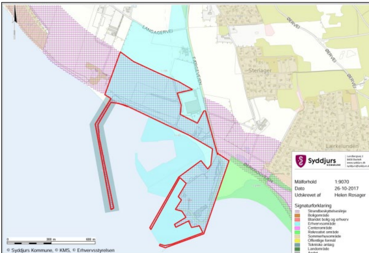
Figur 1. Kortudsnittet viser Syddjurs Kommunes forslag til ændring/ophævelse af strandbeskyttelseslinjen på og ved Ebeltoft Færgeshavn. Det ansøgte areal er markeret med rødt omrind.

Syddjurs Kommune har ansøgt om ophævelse af strandbeskyttelseslinjen på et areal på og ved Ebeltoft Færgeshavn, se figur 1.