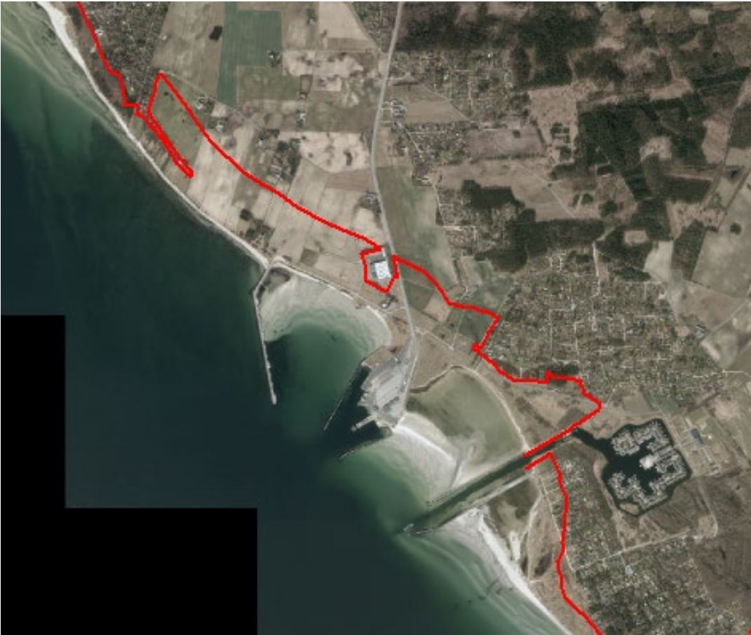
Figur 2. Luffoto 2017 viser Ebeltøft Færgehavn. Strandbeskyttelseslinjen er markeret med rød.

Det ansøgte areal er ikke omfattet af naturfredning efter naturbeskyttelseslovens kapitel 6.