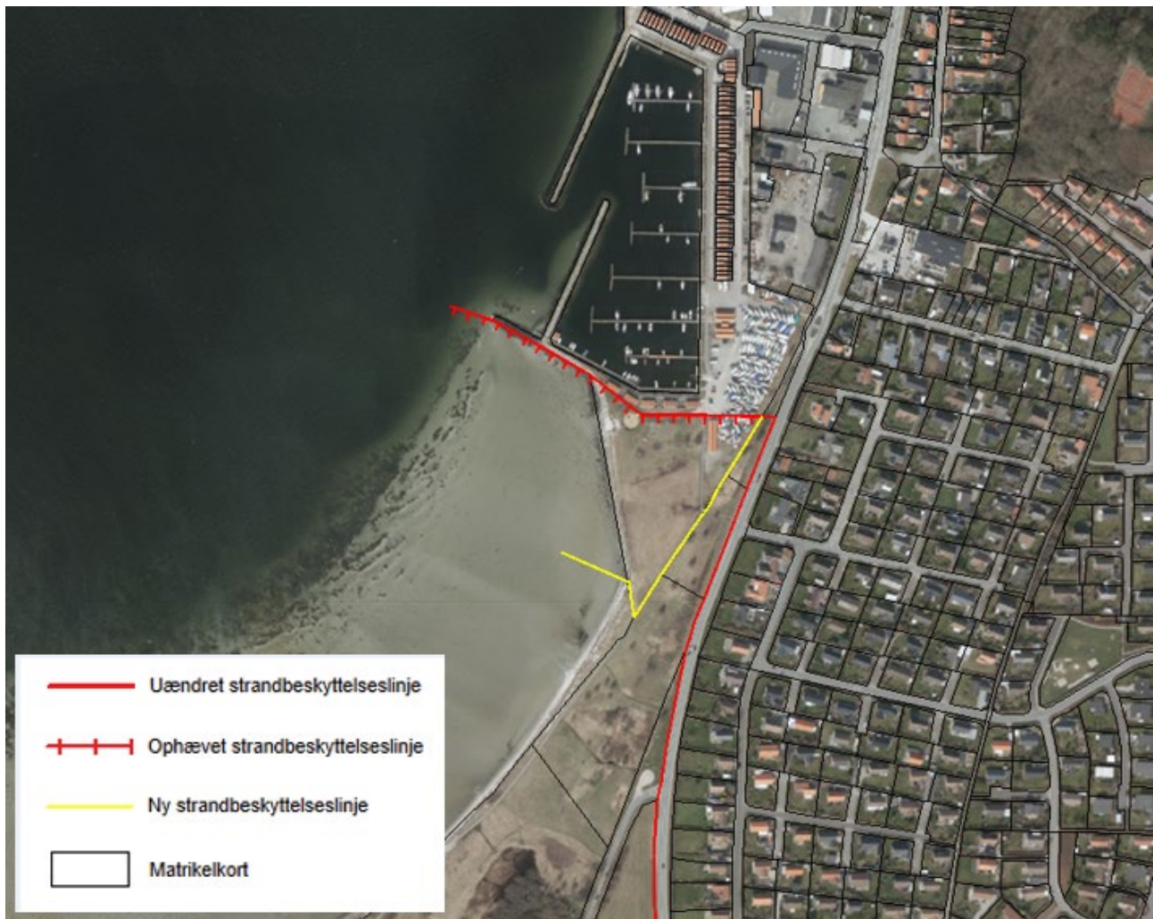
Figur 3. Kortudsnittet viser det nye forløb af strandbeskyttelseslinjen ved Ebeltøft Skudehavn som fastlagt af Kystdirektoratet