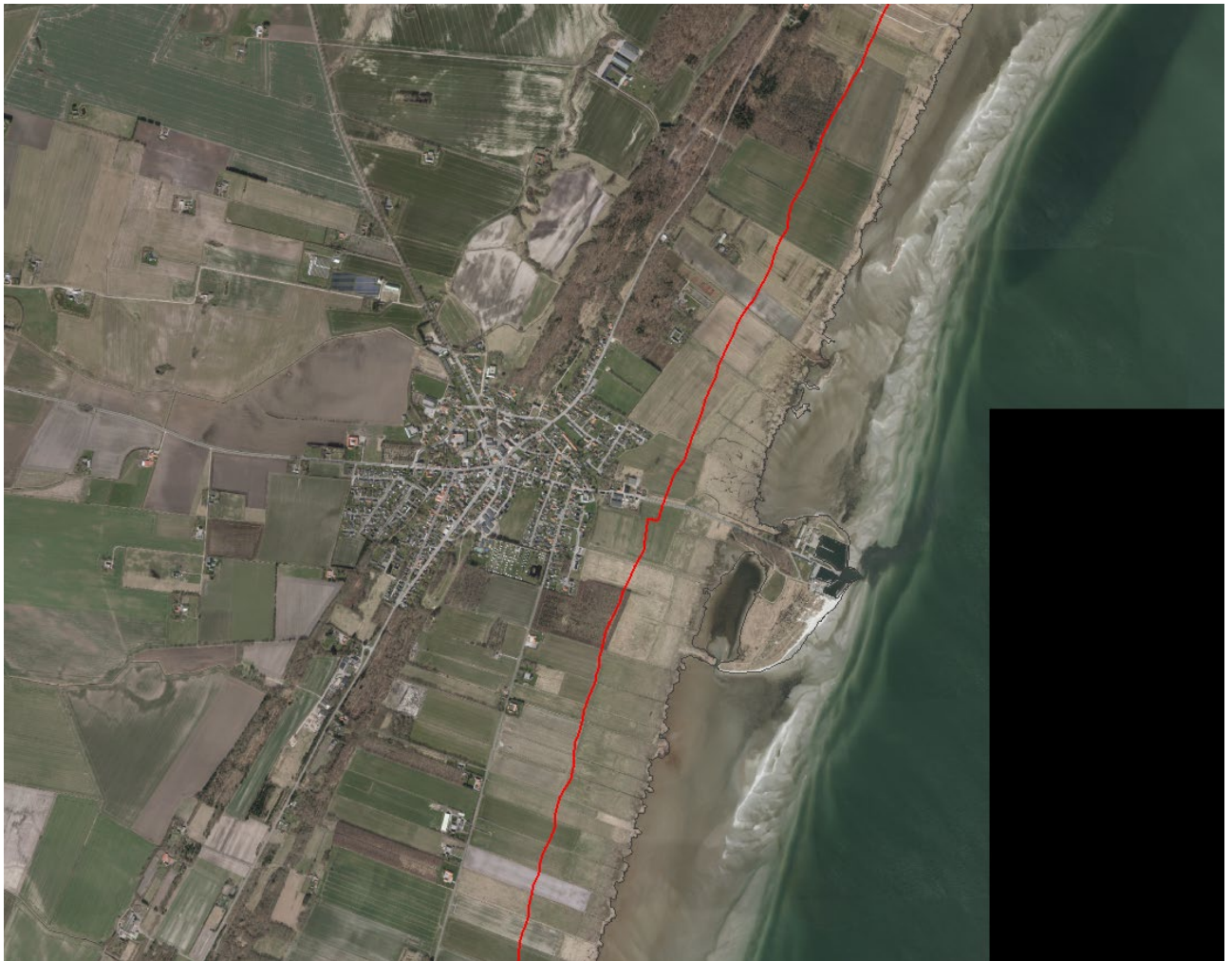
Figur 2. Luftfoto 2017 viser Asaa Havn til højre i billedet. Strandbeskyttelseslinjen er markeret med rød.

De ansøgte arealer er ikke omfattet af naturfredning efter naturbeskyttelseslovens kapitel 6.