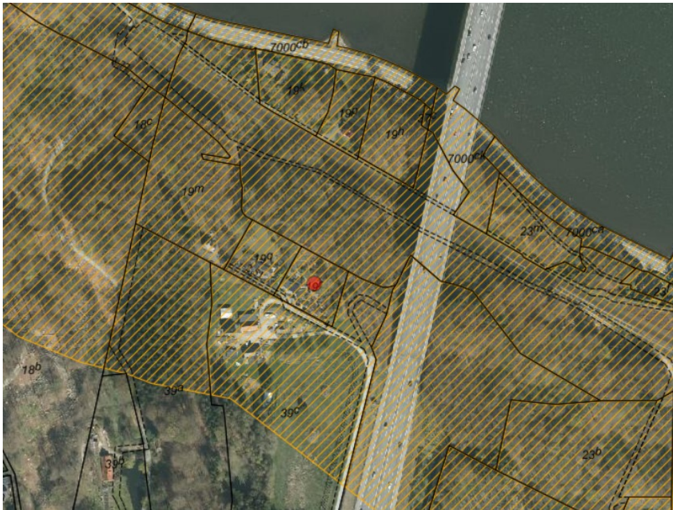
Oversigt over området. Ejendommen er markeret med en rød prik.