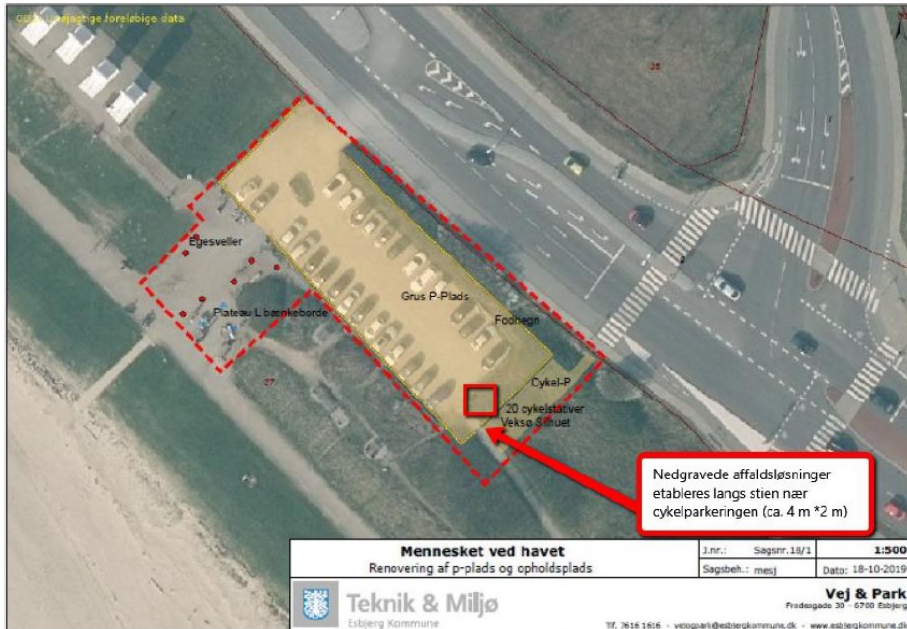
Fig. 1. Foreslået areal, hvor de nedgravede affaldsløsninger ønskes placeret.

Den nedgravede affaldsløsning ønskes som erstatning for de eksisterende fritstående affaldsbeholdere på arealet. Der ønskes tre nedgravede affaldsbeholdere opsat som på fig. 2 inden for et areal på ca. 4 x 2 m. En affaldsbeholder til restaffald og bioaffald (se mål på fig. 3), en til papir/pap og en til metal/glas/plast (se mål på fig. 4).