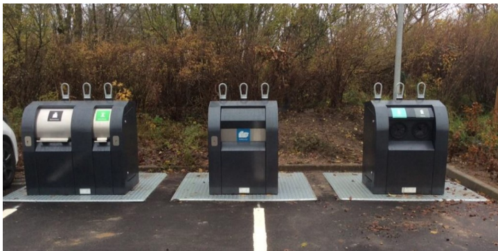
Fig. 2. Billedeksempel fra Ribe på lignende affaldsløsning.