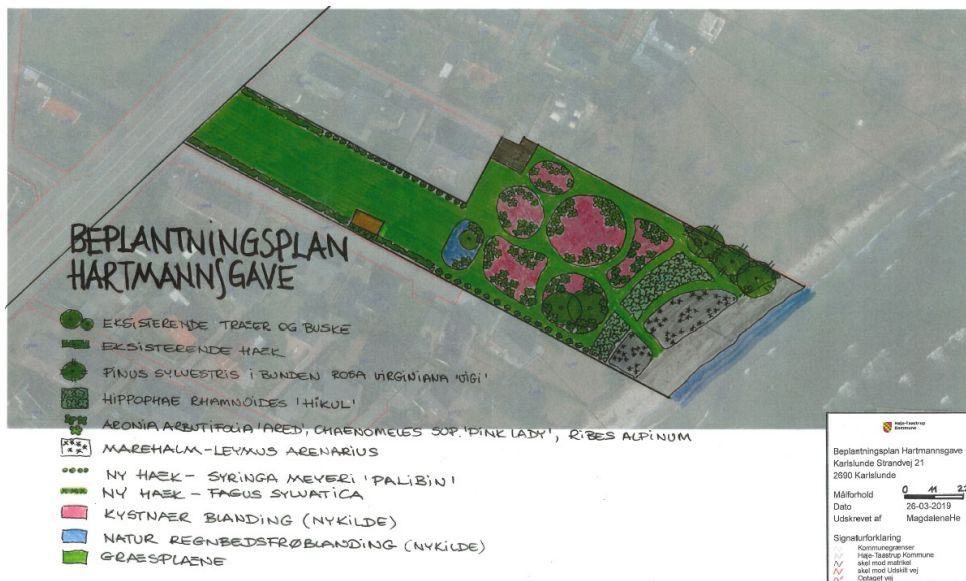
Fig. 2. Beplantningsplan for Hartmannsgave.

En del af arealet er registreret som §3 beskyttet overdrev (Naturbeskyttelsesloven). Derudover er arealet er omfattet af fredningen Mosede Fort samt lokalplan 13.47 Strandvejsområdet.