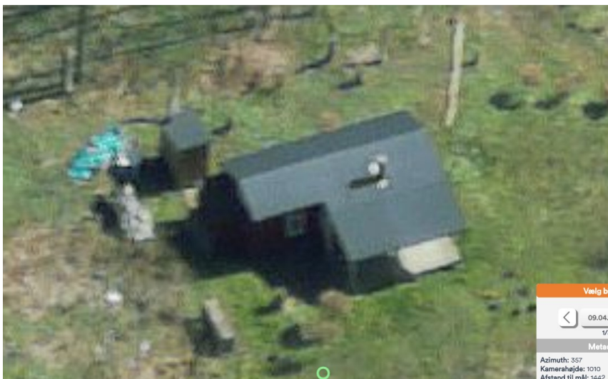
Ejendommen med fritliggende toiletbygning