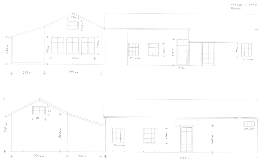
Facader af ny bebyggelse