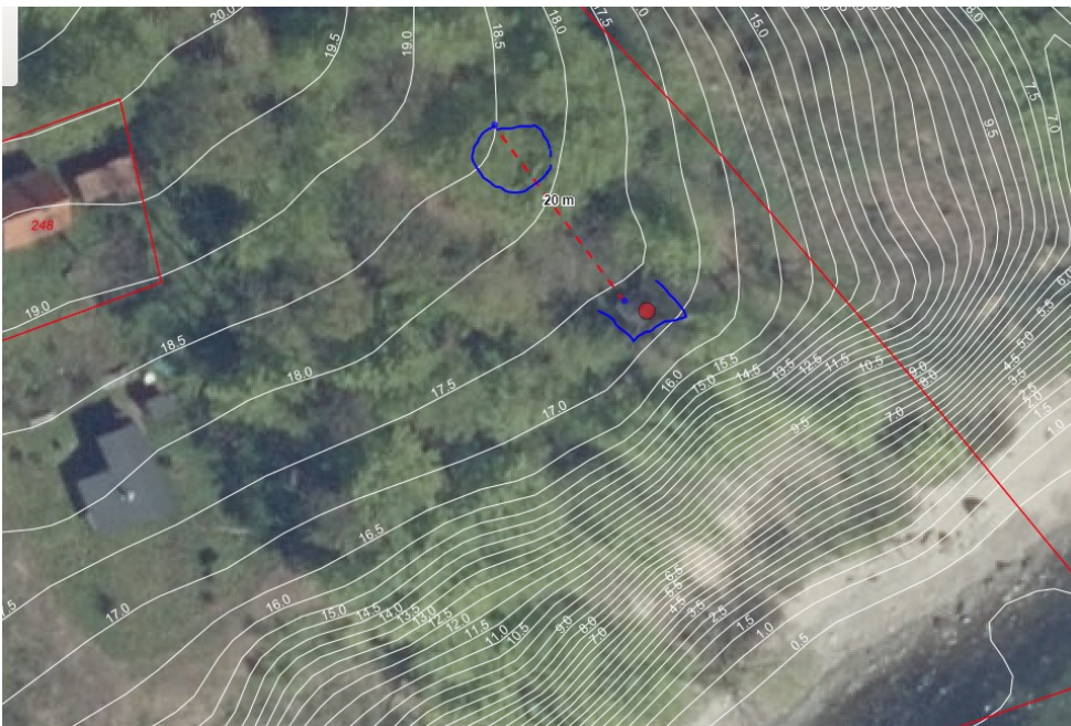
Nuværende og ny placering – 0,5 m højdekurver