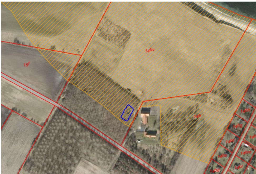
Omtrentlig placering af byggeriet – strandbeskyttelseslinjen skraveret

Bebyggelsen placeres 50 m fra vejen ud for den eksisterende driftsbygning og i en afstand af 20 m fra driftsbygningen og i en skovbevoksning. Placeringen svarer til den, der blev godkendt til stakladen.