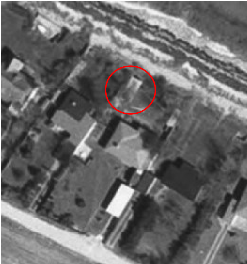
Luftfoto af ejendommen fra 1975, hvor bådskuret ses. Indsat fra Danmark set fra luften.

Ejendommen ligger ca. 500 meter fra Natura 2000-område nr. 116 (habitatområde nr. 100, fuglebeskyttelsesområde nr. 98), jf. bekendtgørelse nr. 1595 af 6. december 2018 om udpegnings og administration af internationale naturbeskyttelsesområder samt beskyttelse af visse arter.