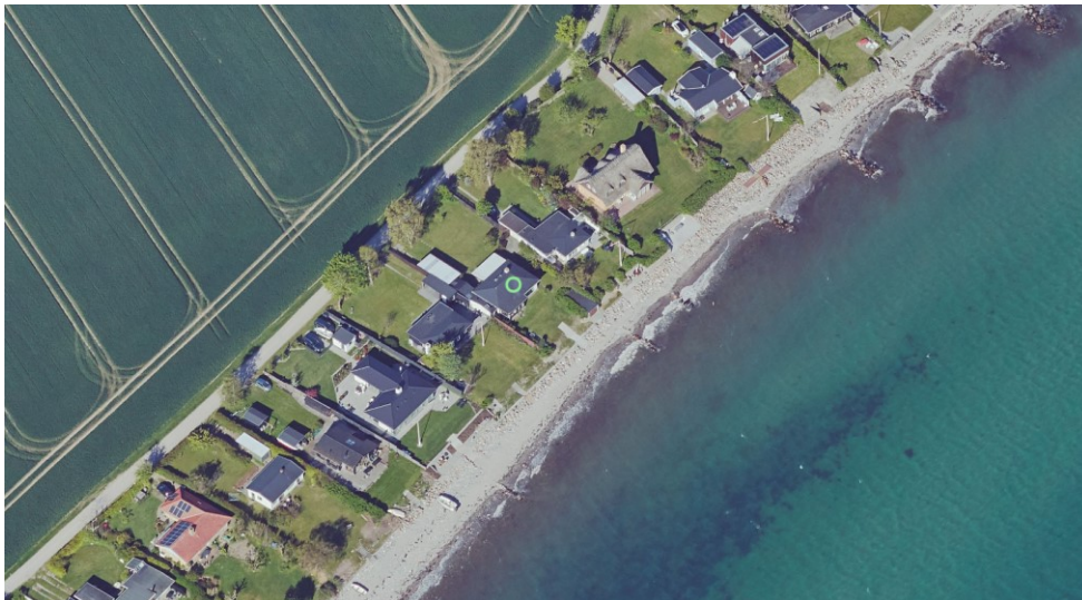
Luftfoto fra området. Ejendommen, som sagen vedrører, er markeret med en grøn cirkel. Indsat fra kortforsyningen.dk

Ved vandet på ejendommen ligger et bådeskur, der efter det oplyste er ca. 21. kvm. Skuret er ikke registreret i BBR, og der er ikke søgt om tilladelse til det efter Naturbeskyttelsesloven ved opførelsen. Ejeren søger nu Kystdirektoratet om lovliggende dispensation til bådeskuret.