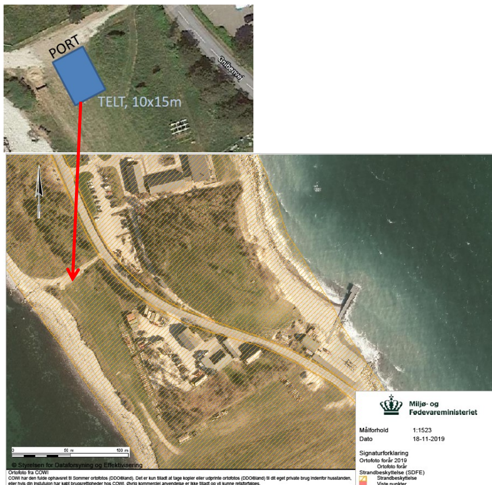
Fig. 1. Placering af telthal på kortudsnit. Orange skravering angiver strandbeskyttelseslinjen.

Den ønskede telthal måler i grundplan ca. 10x15 m og en kiphøjde på ca. 8 m (fig. 2), og monteres med en hvid dug og en grå skydeport.